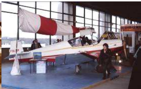
NM à la Foire de Nantes en avril 1977