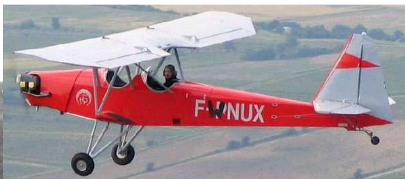
Encore en F-W après restauration