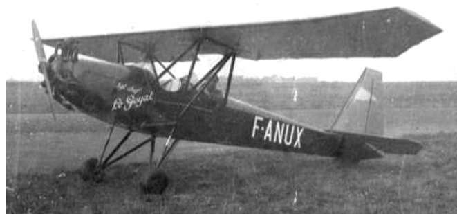
Le Potez F-ANUX à Château-Bougon