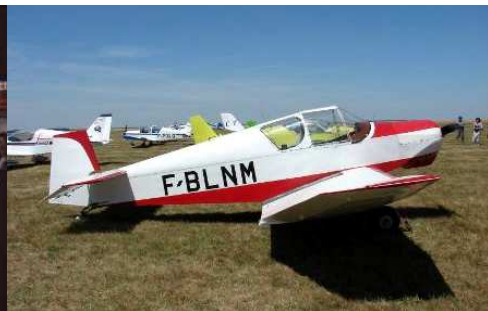
À Blois en 2011