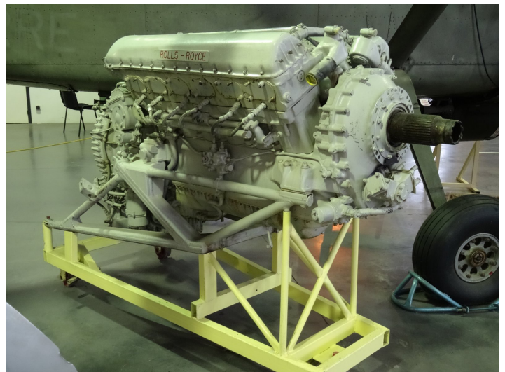
Un moteur Rolls Royce de Casa 2.111 « Pedro » est préservé à Espace Air Passion (Angers Marcé).