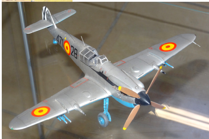
Maquette au 1/48° du Hispano-Aviacion HA-1112 M/C.4K, « Buchon » aux couleurs de l'Ejército del Aire (Armée de l'Air) Réalisation de Michel Tonnevy

La très belle couverture est due à Paul Lengellé.