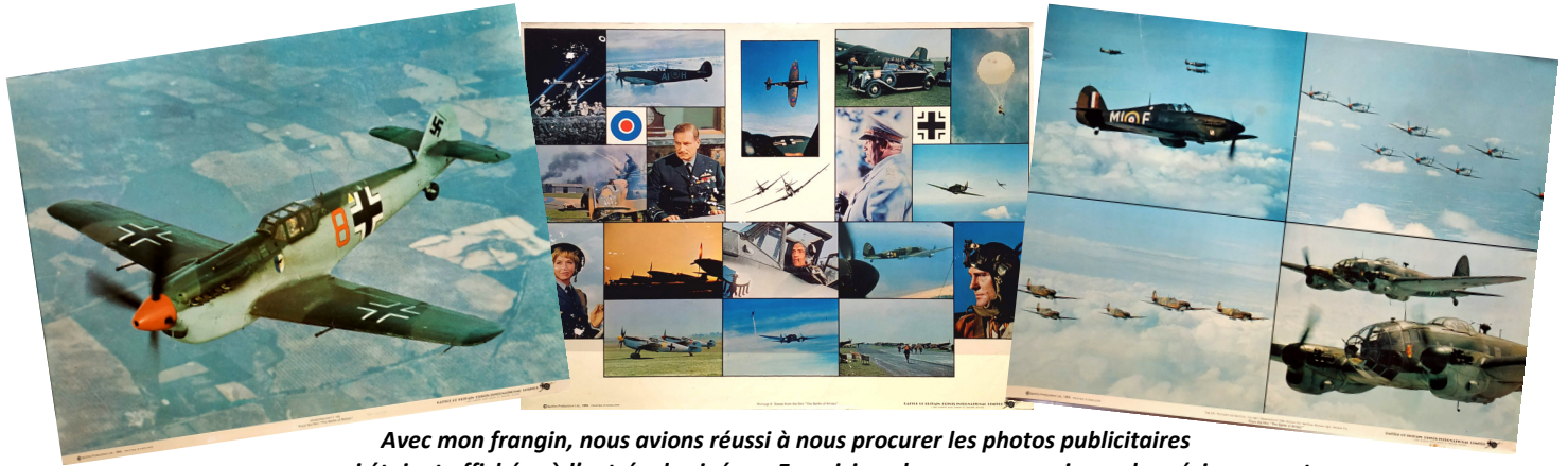
Avec mon frangin, nous avons réussi à nous procurer les photos publicitaires qui étaient affichées à l'entrée du cinéma. En voici quelques unes que je garde précieusement.

Des Hawker « Hurricane » furent aussi utilisés pour le film. Ce type d'appareil constituait en fait l'essentiel des effectifs du Fighter Command en 1940.