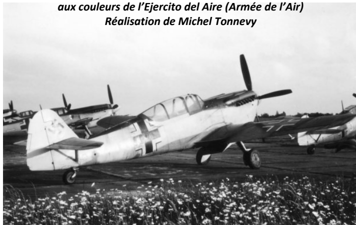
Une curiosité dans le groupe : une version biplace HA-1110 K/C.4K

Les Spitfire utilisés pour le film n'étaient bien sûr pas du type exact de 1940, mais seul un œil exercé peut faire la différence entre un Mk I ou II de l'époque et les Mk IX ou XIV du film. De plus, pour figurer des formations britanniques plus étoffées, des « Buchon » faisaient la foule au second plan.